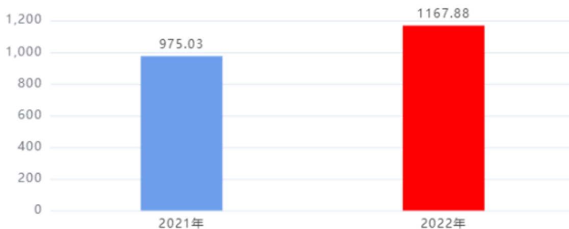
财政拨款收入、支出总计对比图 (单位：万元)

2022年度财政拨款收入总计、支出总计均为1,167.88万元，与上年相比收入总计、支出总计均增加192.85万元，增长19.78%，增长的主要原因是：业务活动增加，财政拨款收入支出增长。